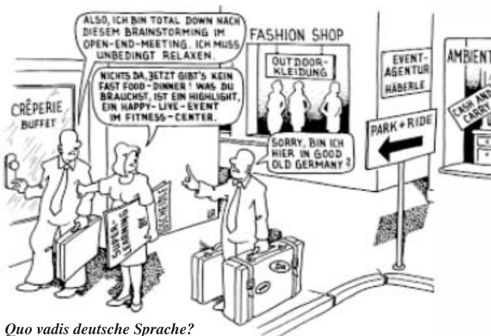
Quo vadis deutsche Sprache?

In der Beilage zu den Mitteilungen 4/2002 gab die Entgleisung «Liebe Mitgliederinnen» zu deutlichen Kommentaren Anlass. Die Redaktion SKD hatte keine Möglichkeit zur Korrektur eines anderswo gedruckten Textes. Richtiger Plural für Männer und Frauen ist einzig «Mitglieder».